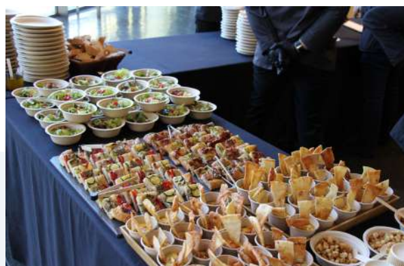
Dinar de les X Jornades del Codinucat ofert pel càtering El Ginjoler