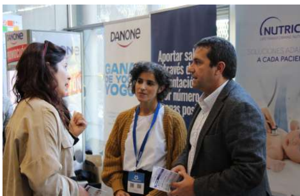
Moments de compartir opinions i experiències després del dinar entre assistents i patrocinadors

Abans de passar al dinar, amb productes de proximitat i de temporada, els assistents van poder gaudir d’una altra pausa activa, amb estiramens i exercicis de relaxació. Seguidament, es va procedir al dinar, un moment de retrobament amb els companys i companyes, tant esperat en els darrers temps de pandèmia.